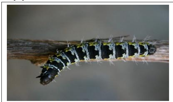
Cirina forda sur la branche

La chenille comestible de l'espèce des lépidoptères Cirina forda a constitué le principal matériel biologique à l'aide duquel les analyses au laboratoire étaient facilitées dans le but de déterminer les principaux nutriments essentiels capable de répondre à la sécurité alimentaire de la population vivant dans ces contrées.