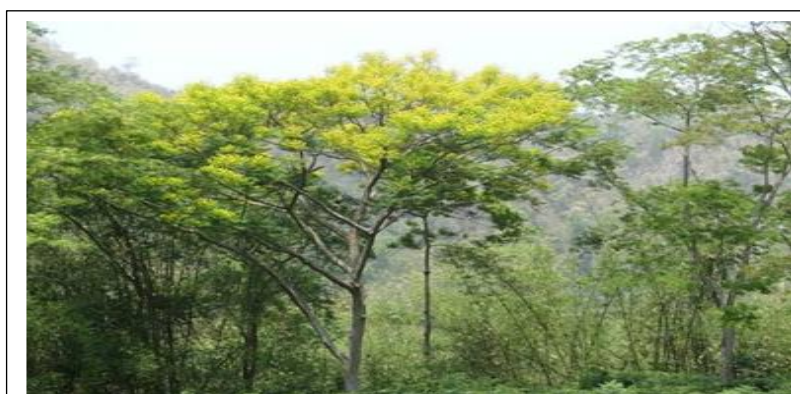
Plante hôte Erythrophloeum africanum

La chenille Cirina forda appelée Mingolo dans le Kwango – Kwilu et Ngala dans le Kongo – Central (Monzambe et al, 2002) a pour principale plante hôte l'espèce Erythrophloeum africanum (M'pala) appartenant à la famille des fabacées.